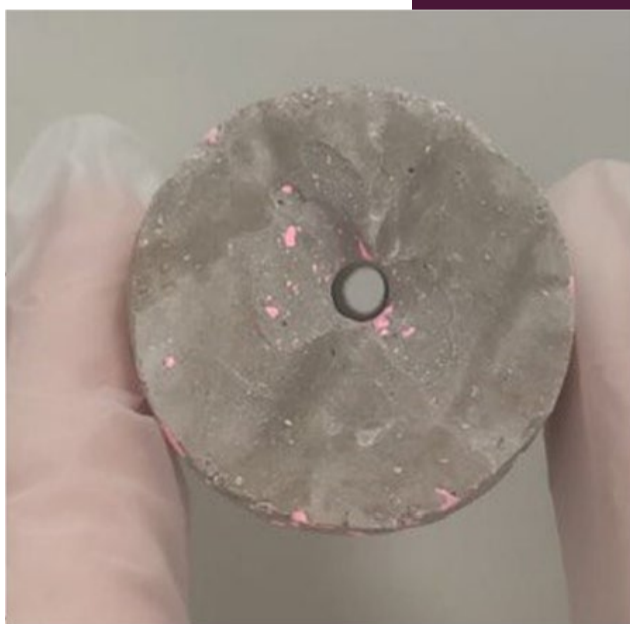
Образец маркированного цементного камня

работу не только над усовершенствованием существующих продуктов, но и разработкой новых технологических решений. Гидрозапирающий пропант является результатом синергии нескольких направлений непрерывных поисковых работ, проводимых нами. Мы уверены, что данный продукт, относящийся к такому массовому сегменту, как ГРП, найдет быстрое и широкое применение как со стороны нефтепользователей, так и наших сервисных партнеров».