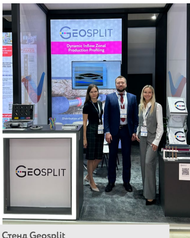
Стенд Geosplit Выставка Caspian Oil and Gas 2023

В Баку завершилась 28-я Международная выставка и конференция «Нефть и Газ Каспия», объединившая более 7 500 участников из 38 стран мира. В ходе выставочной программы 331 компания представила новейшие разработки для нефтегазовой индустрии.